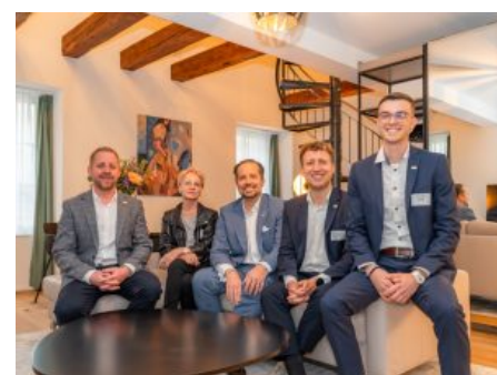
Das Team von Glandon feiert die Eröffnung in Luzern